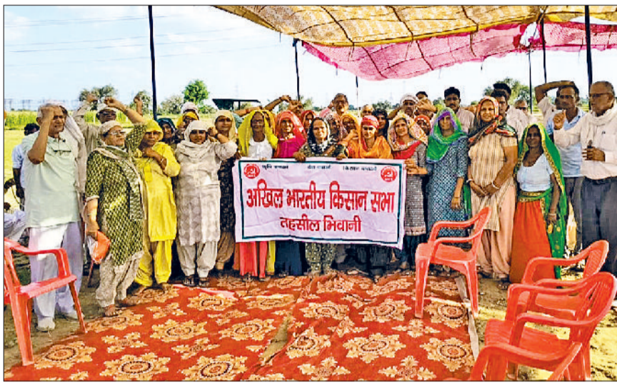
भिवानी। सहमति बनने के बाद मौके पर किसान संगठन व ग्रामीण।