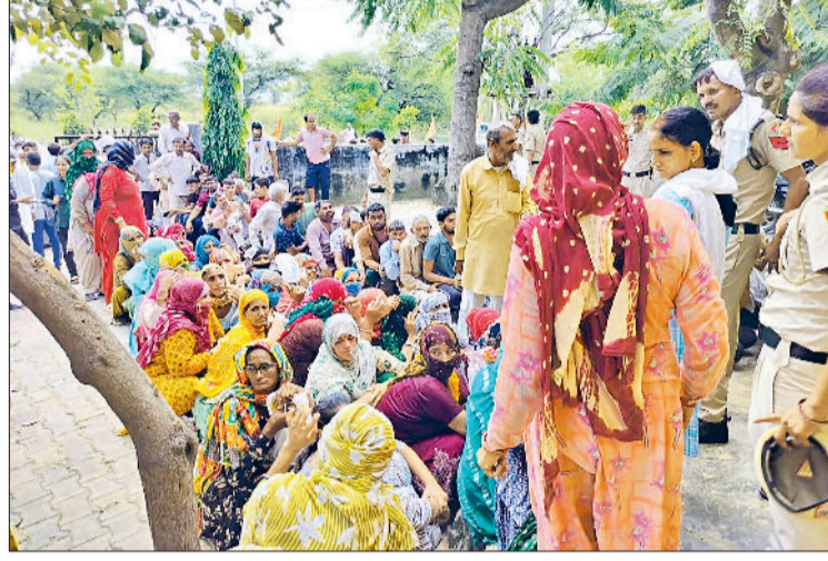
बाढ़ड़ा। टोकन पाने के लिए बेकाबू भीड़ और करबे के खाद बिक्री केन्द्रों पर खाद के लिए महिलाओं को संभालते पुलिस कर्मी।