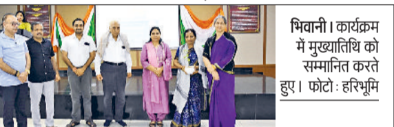
भिवानी। कार्यक्रम में मुख्यातिथि को सम्मानित करते हुए।