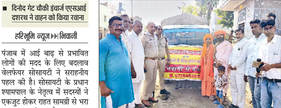
भिवानी। बाढ़ राहत सामग्री से भरे वाहन को रवाना करते हुए।

लिए शीघ्र ही गांव में तटबन्ध बनाया जाएगा। पानी की निकासी के लिए तोशाम बवानी खेड़ा पर 15 क्यूसेक पानी निकासी के दो बिजली के पम्प सैट लगाए गए हैं। तीन किलोमीटर लम्बी नई ड्रेन बनाकर तोशाम हांसी