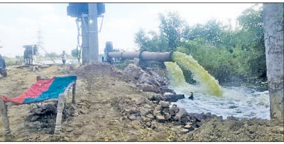
तोशाम। गांव सागवान का बारिश का पानी निकासते पम्प।

लिए शीघ्र ही गांव में तटबन्ध बनाया जाएगा। पानी की निकासी के लिए तोशाम बवानी खेड़ा पर 15 क्यूसेक पानी निकासी के दो बिजली के पम्प सैट लगाए गए हैं। तीन किलोमीटर लम्बी नई ड्रेन बनाकर तोशाम हांसी