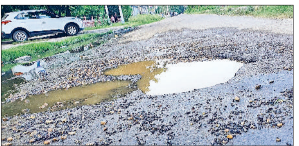
भिवानी। टूटी सड़कों पर बने गड्डों में जमा बारिश का पानी।

उसकी जगह पर गड्डे बन गए हैं। बारिश का पानी उनमें जमा होने से वाहन चालकों को गड्डे नजर नहीं आ रहे हैं। जिसके चलते खासकर दोपहिया वाहन उनमें गिर कर जख्मी हो रहे हैं। सबसे बुरी स्थिति बासिया भवन के पास बनी है। यहां पर सचिवालय की तरफ मुड़ने वाले रोड़ पर करीब तीन से चार फुट लंबी दूरी तक के गड्डे बने हैं। इसी तरह जेल के पास व उससे थोड़ा सा आगे निकलने के बाद गड्डों ने वाहन