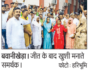
बवानीखेड़ा। जीत के बाद खुशी मनाते समर्थक।