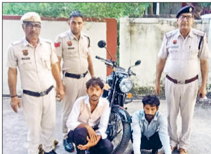
लोहारू। पुलिस हिरासत में चोरी के आरोपी।