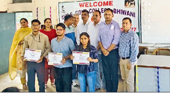
भिवानी। विज्ञान प्रदर्शन में प्रतिभागी को सम्मानित करते हुए।

उन्होंने कहा कि सप्ताह में सोमवार व वीरवार को सुबह 10 से 12 बजे तक समाधान शिविर आयोजित किए जा रहे हैं। इस दौरान विभिन्न विभागों के अधिकारी मौजूद रहे।