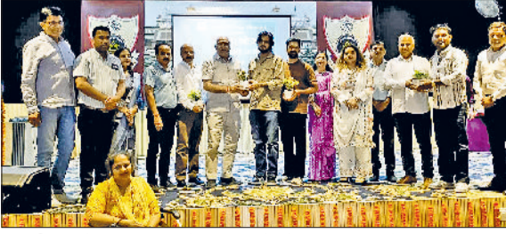
भिवानी। आयोजित कार्यक्रम में प्रतिभागियों को सम्मानित करते हुए।