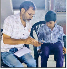
बावानीखेड़ा। बच्चों का असेसमेंट का कार्य पूरा करते शिक्षक।

खंड बावानीखेड़ा में दो दिनों तक चलने वाले दूसरे से तीसरी कक्षा के बच्चों के असेसमेंट के पहले दिन सभी शिक्षक निर्धारित स्कूलों में पहुंचे और विभाग के आदेशों की पालना करते हुए असेसमेंट के कार्य को पूरा किया। मंगलवार को गणित का आकलन किया जाएगा। प्रदेश का शिक्षा विभाग समय समय पर शिक्षा स्तर की जांच कर उसे ऊंचाइयों तक ले जाने के लिए भरसक प्रयास करता है और नई नई रणनीतियां बनाकर उसमें सफलता भी हासिल करता है। हालिया नई योजना बनाई गई है जिसमें 15 व 16 सितंबर को राजकीय विद्यालय में पढ़ने वाले दूसरी व तीसरी कक्षा के विद्यार्थियों का संख्या ज्ञान के स्तर पर आकलन निर्धारित किया था जिसके तहत खंड स्तर पर खंड शिक्षा अधिकारी के नेतृत्व में एबीआरसी, बीआरपी की ऑनलाइन मीटिंग भी आयोजित हुई थी। तत्पश्चात एबीआरसी, बीआरपी द्वारा कलस्तर स्तर पर शिक्षकों को प्रशिक्षण दिया।